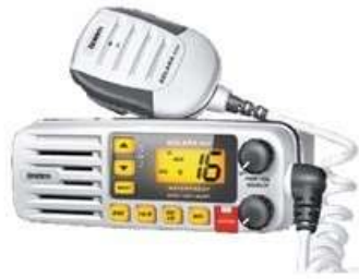
Radio de comunicação VHF