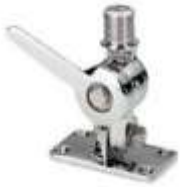
Suporte para antena