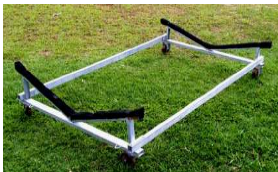
Carreta de encalhe