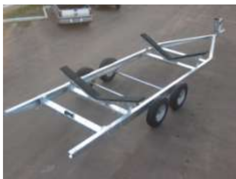
Carreta rodo-encalhe galvanizada a fogo