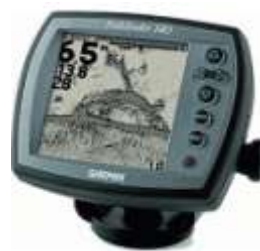
Fishfinder preto e branco