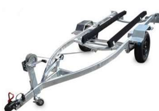
Carreta rodoviária galvanizada a fogo