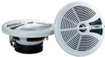
Alto falante 6.1/2"