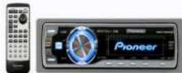
Radio CD player