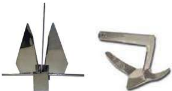
Danforth ou Bruce