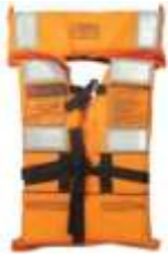
Colete Salva vidas