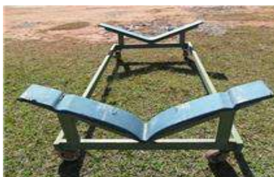
Carreta de encalhe pintada (Flexboat)