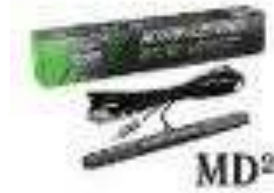
Antena interna para radio